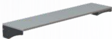
PRATELEIRA DE MADEIRA