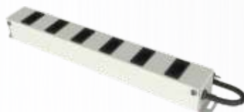
CALHA DE TOMADAS