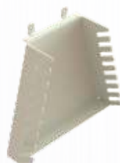
SUPORTE PARA CHAVES