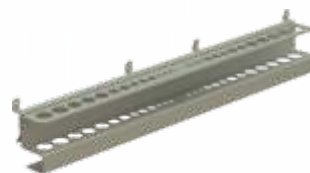
SUPORTE PARA BROCAS