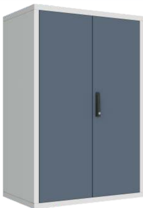
ARMÁRIO COM 4 PRATELEIRAS