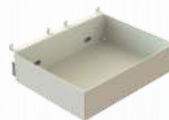
CAIXA DE ARMAZENAGEM