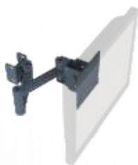
SUPORTE PARA MONITORES