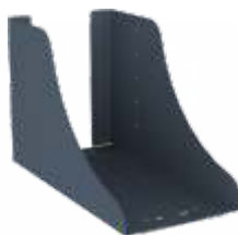
SUPORTE PARA CPU