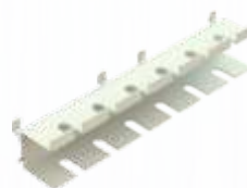
SUPORTE PARA FENDAS