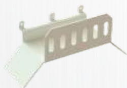
SUPORTE PARA CABOS