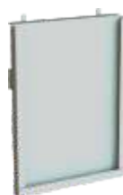
SUPORTE PARA DOCTOS.

Capacidade de carga por prateleira = 50kg Dimensões em milímetros